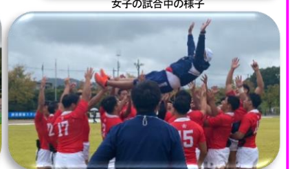
歓喜に沸く少年男子チーム