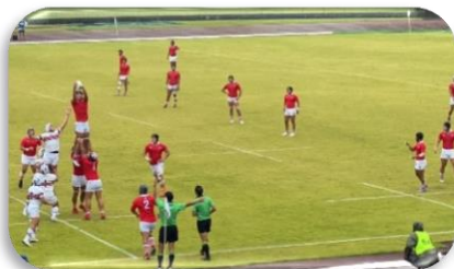
少年男子の試合中の様子