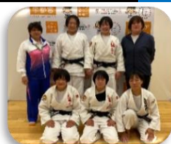
柔道競技女子チーム

ユウケイ武道館(宇都宮市)にて行われた柔道競技。女子は準々決勝で滋賀県と対戦し、1-1から代表戦の末に惜敗。