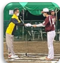
成年男子の表彰式