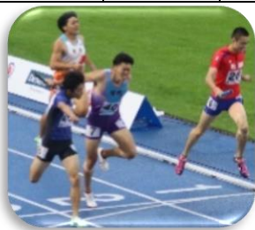
ゴール前のデットヒート

カンセキスタジアムとちぎ(宇都宮市)にて行われた陸上競技。最終日も多数の種目で入賞を果たした本県選手団。陸上競技の最終種目である「男女混合 4×400m リレー」は、今回の国体から初めて実施される種目であった。決勝に出場した本県チームは、ゴール前で鹿児島県と壮絶なデットヒート。勝負は僅か0.03秒差で鹿児島県に軍配。惜敗ながらも堂々の準優勝となった。