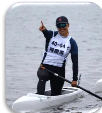
優勝を果たした桐明選手(東京オリンピック日本代表)