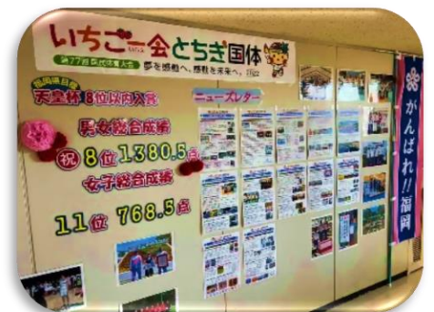
体育スポーツ健康課前の掲示物コーナー

今回の成績が、本県競技力の更なるレベルアップにつながることを切に願っております。