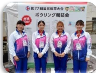
ボウリング競技成年女子チーム

足利スターレーン(足利市)にてボウリング競技成年男女の団体戦の予選が行われた。本県は健闘するも、決勝進出を果たすことはできなかった。