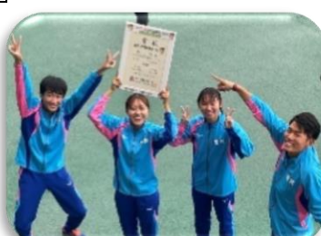
男女混合4×400mリレーのメンバー