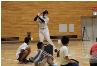
▲ホークスジュニアアカデミーによる野球教室