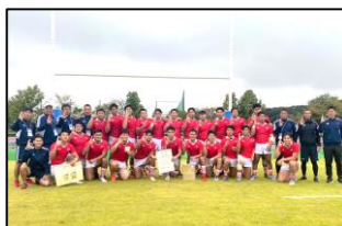
▲ラグビーフットボール競技少年男子（15人制）

ラグビーフットボール競技少年男子（15人制）は、前日の準決勝で栃木県を下し、大阪府との決勝戦に挑みました。接戦の末、18-17の1点差で見事2大会連続、7度目の優勝を果たしました。