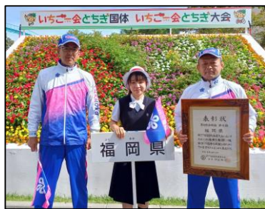
▲閉会式終了後の記念撮影の様子

10月1日（土）、カンセキスタジアムとちぎにて、第77回国民体育大会「いちご一会とちぎ国体」総合開会式が3年ぶりに開催されました。福岡県選手団は、男女総合成績8位以内入賞という目標を掲げ、福岡県の代表としての誇りを胸に、それぞれの競技に挑みました。会期前10日間、本会期11日間の奮闘の末、見事、男女総合成績8位入賞、女子総合成績11位を果たしました。県内競技団体の長きにわたる選手強化活動が実を結んだ4年ぶりの8位入賞でした。