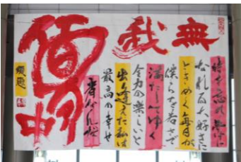
▲須恵高等学校書道部による書道作品

Instagramを活用し、【スポーツ・運動の「笑顔」「感動」「喜び」を表現しよう】のテーマのもと、アクションフォトコンを実施しました。たくさんのご応募の中から最優秀賞と優秀賞に選ばれた作品です。