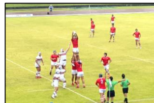
▲ラグビーフットボール競技少年男子（15人制）競技中の様子