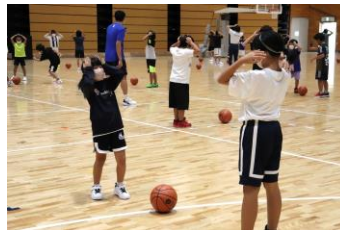
▲ライジングゼファーフクオカによるバスケットボール教室