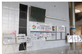
▲令和6年度全国高等学校総合体育大会展示物