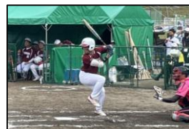
▲ソフトボール競技