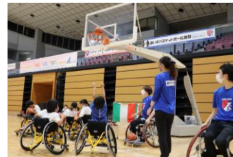
▲ライジングゼファーフクオカ Wheelchairによる車いすバスケットボール体験