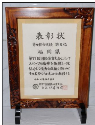
男女総合成績第8位表彰状▶