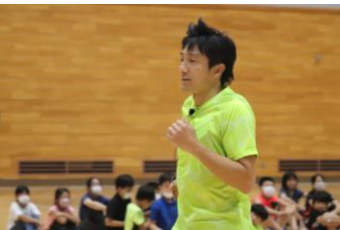
▲北京オリンピック銀メダリスト 朝原宣治氏による陸上クリニック