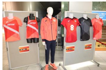
▲東京2020オリンピック・パラリンピックユニフォーム