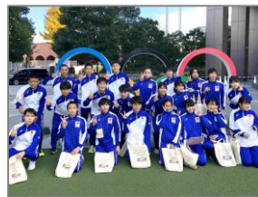
【オリンピックミュージアム】