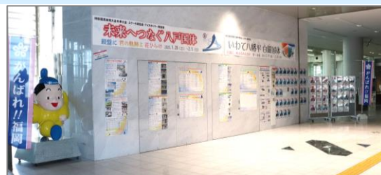
▲大会期間中、福岡県立スポーツ科学情報センターにて応援コーナーを設置しました。

今回、福岡県選手団は男女総合成績（天皇杯）14位、女子総合成績（皇后杯）14位という結果でした。各競技、冬の寒さに負けない熱い戦いを繰り広げました。2020年に開催予定であった第75回国民体育大会「燃ゆる感動かごしま国体」が今年の10月に特別国民体育大会として開催されます。冬季大会ですばらしい戦いを繰り広げた選手たちの熱い思いをつなぐ、鹿児島国体では、福岡県選手団が大いに活躍し、2年連続8位以内入賞を果たすことを願っています。