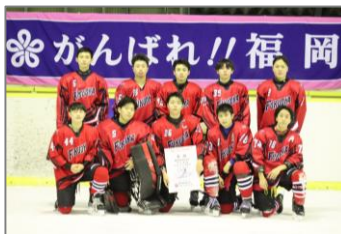
▲アイスホッケー競技 少年男子

2月1日（水）～2月5日（日）にテクノルアイスパーク八戸、FLAT HACHINOHE、ふくちアイスアリーナの3会場にてアイスホッケー競技が行われました。2月4日（土）には、ふくちアイスアリーナにて少年男子の7・8位決定戦が行われ、愛知県と対戦しました。白熱した試合を繰り広げましたが2-4で惜敗し、最終成績8位で大会に幕を閉じました。