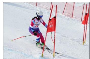
▲スキー競技 競技中の様子