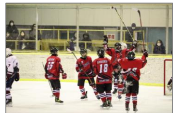
▲アイスホッケー競技 少年男子 競技中の様子