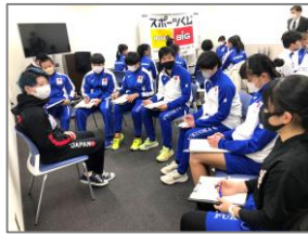
【修了生ディスカッション】