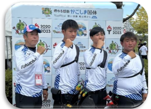
【アーチェリー競技 少年男子】

また、成年女子、少年女子も予選リーグを突破し、5位入賞を果たした。 (競技別総合成績 3位 )