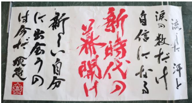
▲須恵高校書道部による書道作品