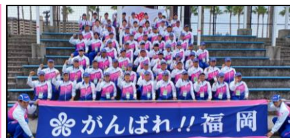
▲47名の選手及び監督 合計72名が福岡県選手団