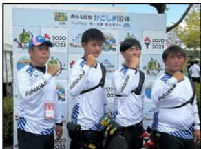
▲アーチェリー競技少年男子団体

陸上競技では、成年少年男女混合4×400mリレーで見事優勝し、他にも多くの選手が入賞しました。また、競技別総合成績でも1位となり有終の美を飾りました。