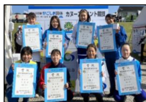
▲桐明選手(上段右から2番目)