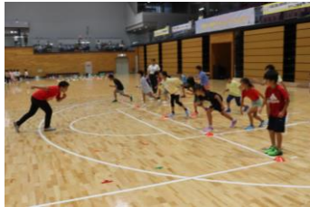
▲九電工陸上競技部による 陸上教室