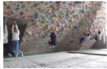
▲福岡県山岳・スポーツクライミング連盟によるボルダリング体験会