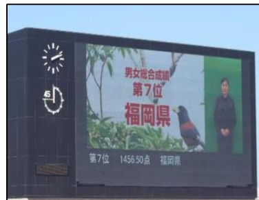
▲オーロラビジョンに映し出された本県成績