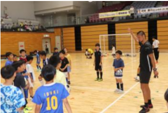
▲サッカー元日本代表 坪井慶介氏による サッカー教室