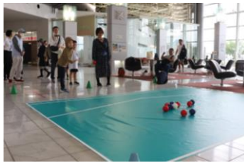
▲総合型地域スポーツクラブによる パラスポーツ体験会