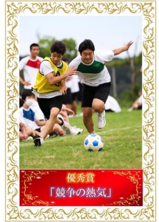
優秀賞 「競争の熱気」