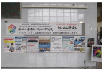
▲令和6年度全国高等学校 総合体育大会展示物