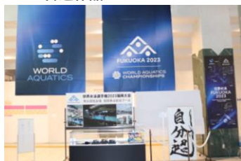
▲世界水泳選手権 2023福岡大会展示物