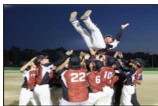
▲ソフトボール成年男子

アーチェリー競技少年男子団体戦では、急な選手変更があったにもかかわらず、いつも通りのパフォーマンスを発揮することができ28年ぶりに3度目の団体優勝を果たしました。