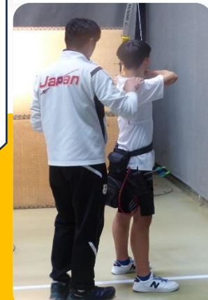
アーチェリー 日本代表コーチ

ホッケー,フェンシング,アーチェリーで 日本を代表するコーチ陣から直接 指導を受けます！