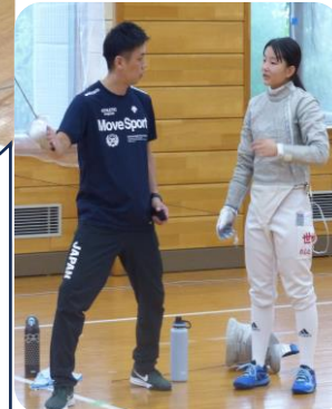
フェンシング U14 ヘッドコーチ