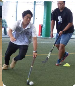
ホッケー U15 ヘッドコーチ